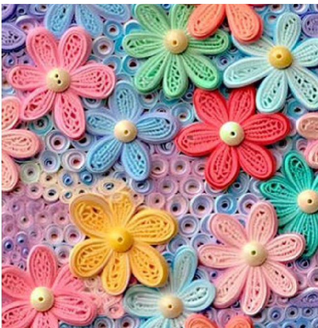
SORVETES DIVERTIDOS - CANDY COLORS 770T.150.902.055.M