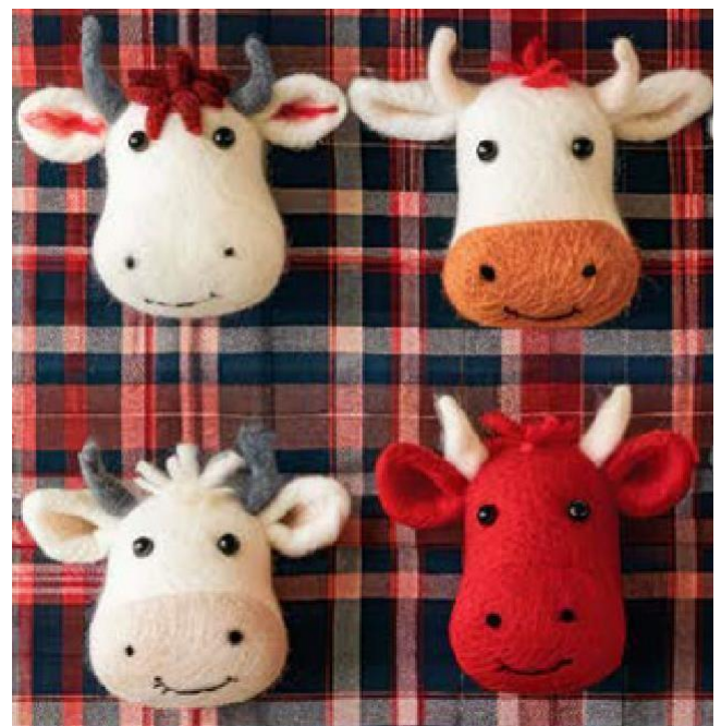
FAZENDA - OVELHINHAS 770T.150.558.055.M