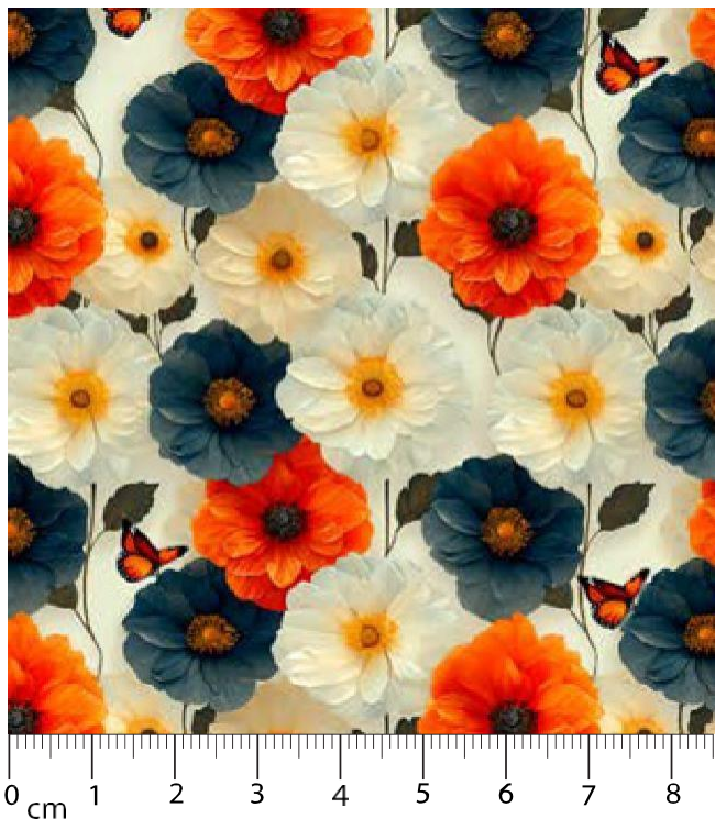
MINI BORBOLETAS E FLORES 770T.150.626.055.M

Os cuidados referem-se ao tecido exclusivamente, caso sejam combinados com outros tecidos, aviamentos, bordados, etc. a confecção deve fazer a alteração das recomendações de cuidados.