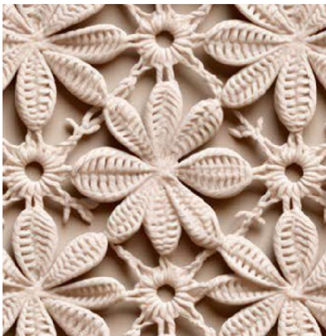
JARDIM DE FLORES COLORIDAS DE PAPEL 770T.150.617.055.M