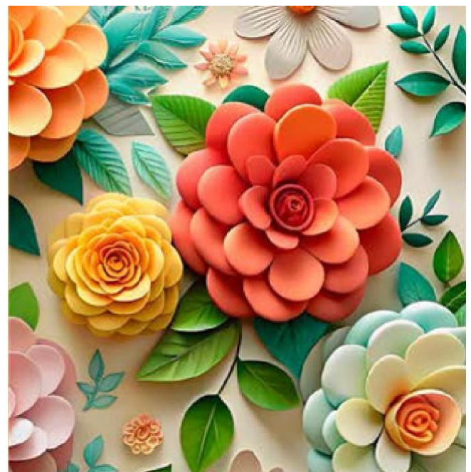
MOSAICO DE FLORES 770T.150.616.055.M