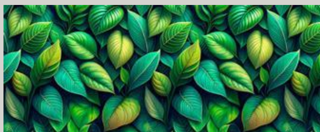
FOLHAGENS TROPICAIS | 770T.150.619.055.M