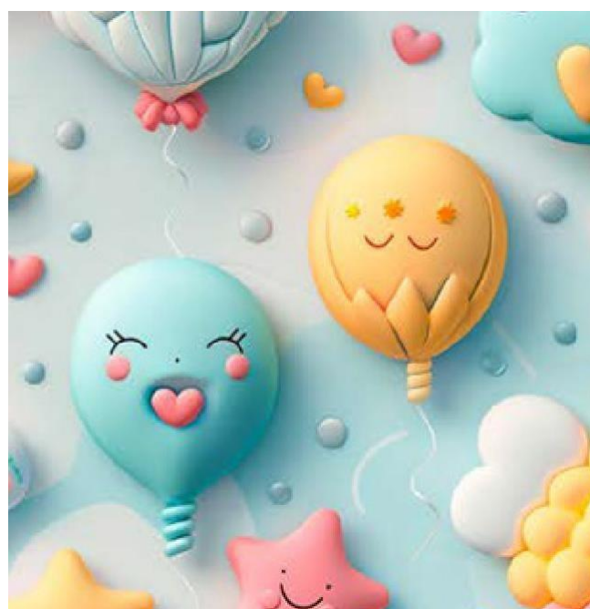
PRIMAVERA ROSA 770T.150.620.055.M