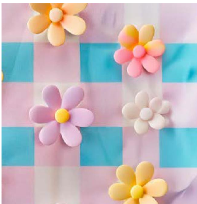
MUNDO COLORIDO 770T.150.621.055.M