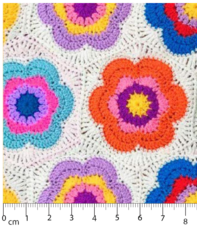
CROCHÊ FLORAL COLORIDO 770T.150.629.055.M