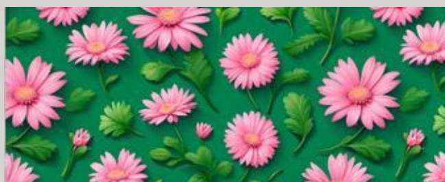
PRIMAVERA ROSA | 770T.150.620.055.M