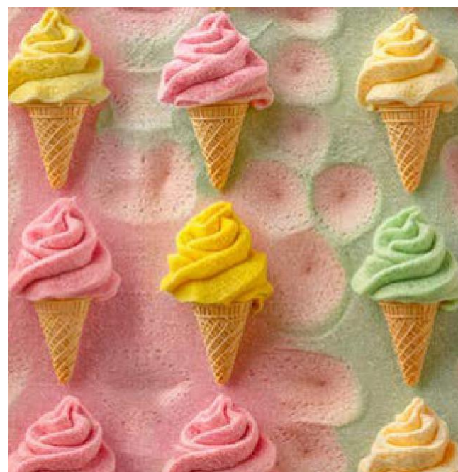
FLORAL VIBRANTE 770T.150.634.055.M