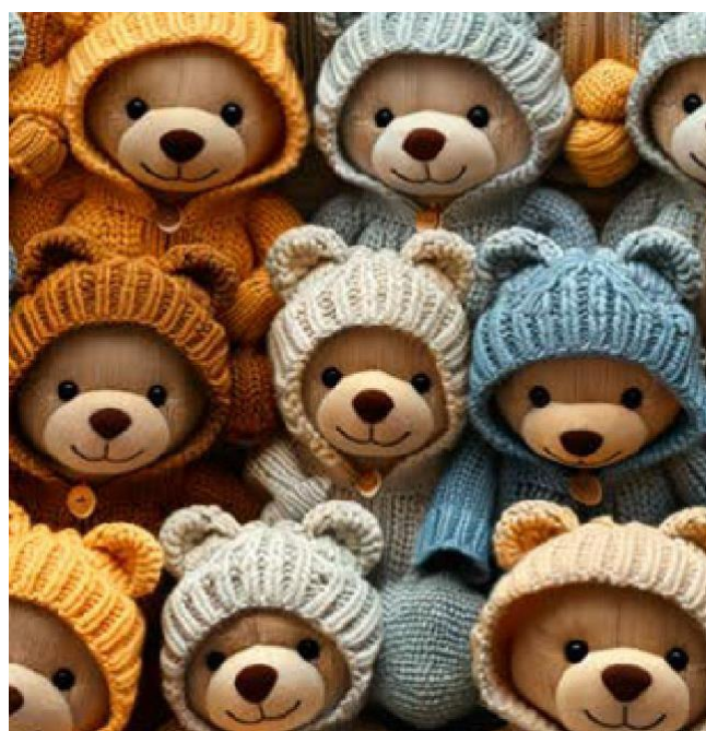
MARGARIDAS - CANDY COLORS 770T.150.622.055.M