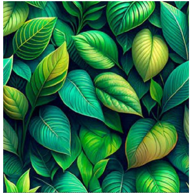
CROCHÊ EM LINHA NATURAL 770T.150.618.055.M