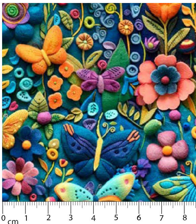
BORBOLETAS NO JARDIM 770T.150.628.055.M