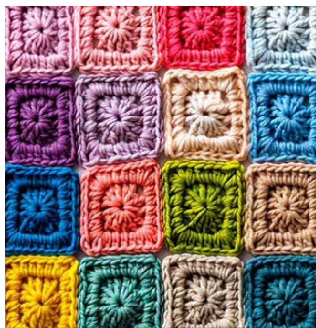
FLORES E FRUTAS 770T.150.630.055.M