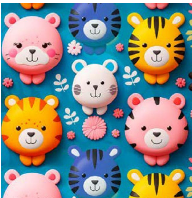
CROCHÊ QUADRADO 770T.150.631.055.M