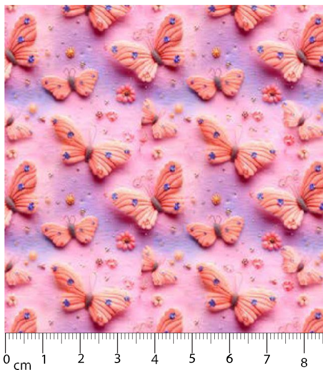
BORBOLETAS FELTRO 770T.150.627.055.M