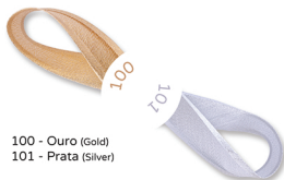
100 - Ouro (Gold) 101 - Prata (Silver)