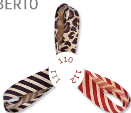
110 - Onça Ouro (Golden Jaguar) 111 - Listra Preta (Black Stripe) 112 - Listra Vermelha (Red Stripe)