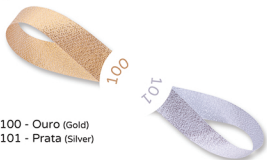
100 - Ouro (Gold) 101 - Prata (Silver)