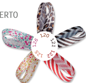
120 - Onça Prata (Silver Jaguar) 121 - Listra Preta (Black Stripe) 122 - Listra Vermelha (Red Stripe) 125 - Liberty Salmão (Salmon Liberty) 126 - Liberty Pink (Pink Liberty)